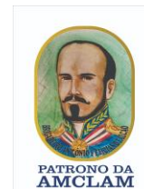
PATRONO DA AMCLAM

Fundada em 31/05/2018 - Personalidade Jurídica em 16/08/2018 - Estatuto publicado no DOE nº 159 de 23/08/2018, Regimento Interno publicado no DOE nº 083 de 06/05/2019 CNPJ 31.865.234/0001-25, Utilidade Pública Lei Municipal (São Luís) nº 6.647 de 07/02/2020